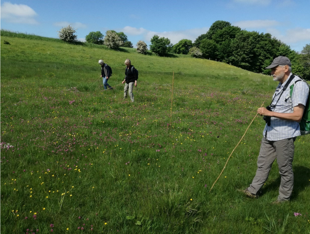
Fra optællingen på engen d. 8/6-2021.